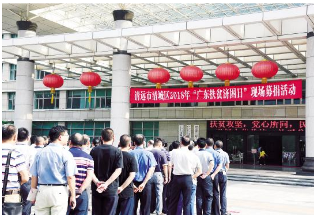
清城区举办“广东扶贫济困日”现场募捐活动。

活动现场,市委常委、高新区(燕湖新区)党工委书记、清城区委书记何国森等区四套领导班子成员、各街镇(场)以及各系统代表依次进行捐赠。据了解,清城区今年围绕省“关爱贫困人口,助力脱贫攻坚”的主题,在做好扶贫攻坚日常工作的同时,广泛组织发动社会各界积极参与捐赠活动。据统计,2017年度(2017年6月1日至2018年5月31日)广东扶贫济困日活动,清城区共接收社会捐款756.37万元,按规定使用捐款1029.51万元(含历年结余资金),其中用于精准扶贫688.48万元;开展资助困难群众6.67万元;资助购买困难残疾人康复用品49.1万元;用于捐赠方向的扶贫济困项目288.26万元。这些捐赠资金的投入使用,改善了清城区贫困人民群众生产生活条件,有力促进了重点困难村的社会经济发展。