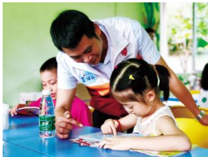
彩虹书室内,志愿者陪伴小朋友阅读绘本。