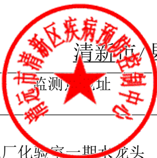
清新区县（市、区）用户水龙头水质监测信息公开表（2021年第 一 季度）