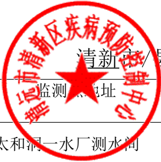
清新区/县（市、区）用户水龙头水质监测信息公开表（2021年第一季）